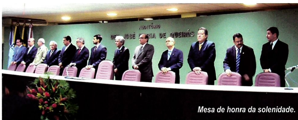
Mesa de honra da solenidade.