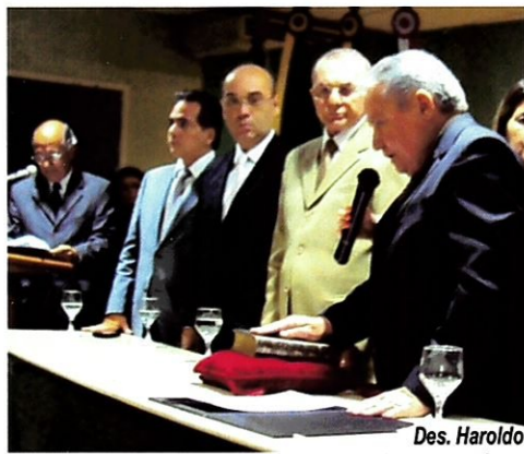
Des. Haroldo presta compromisso.

O desembargador Haroldo Máximo, em seu discurso de posse, destacou que "pela primeira vez a Esmec vai ser dirigida por um ex-coordenador geral". Ele coordenou a Escola no período 2007 - 2008. "Assumo o compromisso de alinhar a Esmec às determinações do Plano Nacional de Capacitação Judicial, sob a supervisão da Escola