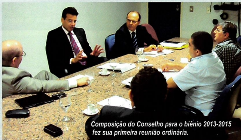
Composição do Conselho para o biênio 2013-2015 fez sua primeira reunião ordinária.