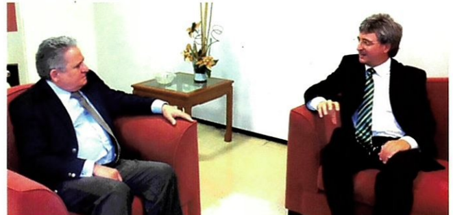
Escola poderá firmar convênio com a ENM para ofertar novos cursos (p. 4)