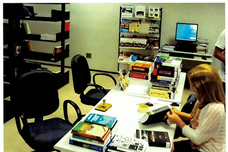
Biblioteca recebe novos livros jurídicos, que estão em fase de catalogação.