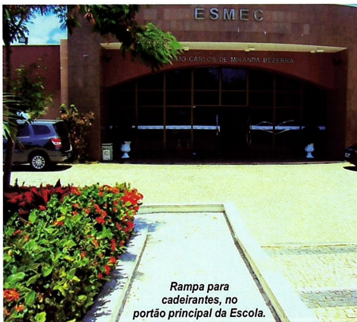
Rampa para cadeirantes, no portão principal da Escola.

Dentre as ações em andamento, destacam-se a aquisição de novos livros jurídicos, que estão em fase de tratamento técnico (catalogação); construção de rampa no portão frontal da Escola, para uso de cadeirantes; e a solicitação à Presidência do Tribunal de Justiça de novos computadores para o laboratório de informática.