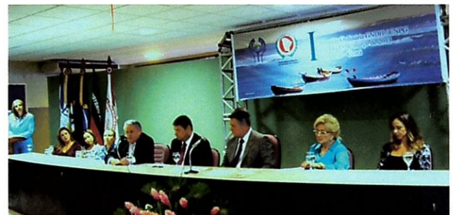
Encontro do GNDH reúne membros do Ministério Público de todo País (p. 12)