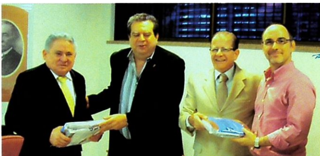
Esmec discute parceria com o IPC na área de educação a distância (p. 5)