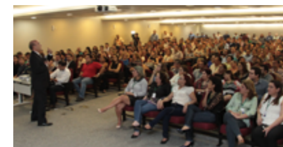
Reunião com servidores no TJCE

Do total de cargos, conforme lei estadual, 50% serão destinados aos servidores de carreira. Dos 398 criados, pelo menos 199 terão como destino os profissionais efetivos. A Presidência do Tribunal garante que as atribuições do assistente de unidade judiciária (comissionado) não se sobrepõem às funções dos analistas judiciários (concursados). São atividades distintas e sem qualquer incompatibilidade quanto à atuação simultânea dos dois servidores.