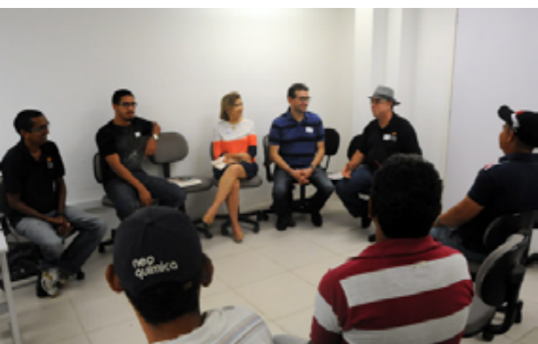
Há ambientes para adultos (pais e mães), crianças e adolescentes

As oficinas incluem palestras, vídeos e depoimentos sobre temas que buscam a reflexão dos conflitos familiares. Já foram realizadas 39 edições do evento, beneficiando 1.334 pessoas. A iniciativa, do Conselho Nacional de Justiça, é realizada desde 2014 pelo Cejusc de Fortaleza, com apoio do Núcleo Permanente de Métodos Consensuais de Solução de Conflitos do Tribunal de Justiça do Ceará.