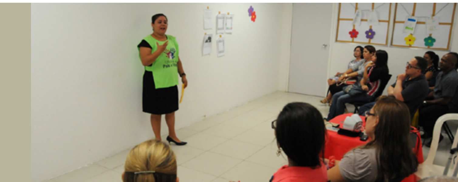
As oficinas ocorrem duas vezes por mês, no Fórum Clóvis Beviláqua, com pessoas envolvidas em conflitos familiares

Famílias envolvidas em processos de separação, divórcio, disputa de guarda e agressões, entre outros, têm a oportunidade de resolver os casos e manter o vínculo. Isso é possível com a “Oficina Pais e Filhos”, realizada duas vezes por mês pelo Centro Judiciário de Solução de Conflitos e Cidadania (Cejusc) de Fortaleza, no Fórum Clóvis Beviláqua.