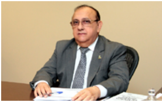
Corregedor explica que o objetivo é auxiliar os juízes

Em relação aos cartorários, o corregedor afirmou que “os notários e registradores têm que oferecer atendimento de qualidade e melhores serviços à população, além de estarem atentos à regularidade e à legalidade do serviço”.