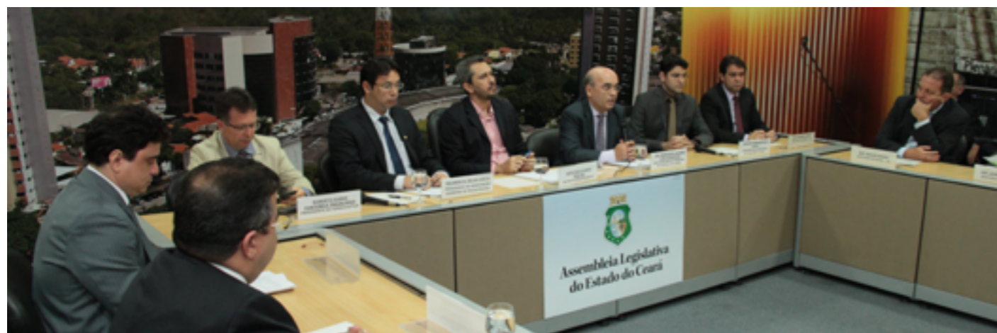
Representantes do Tribunal e demais interessados participam de audiência pública na Assembleia

cato dos Servidores do Judiciário cearense. A mudança diminuirá a força de trabalho, sobretudo nos Gabinetes dos Desembargadores e nas Secretarias das Varas e Juizados.