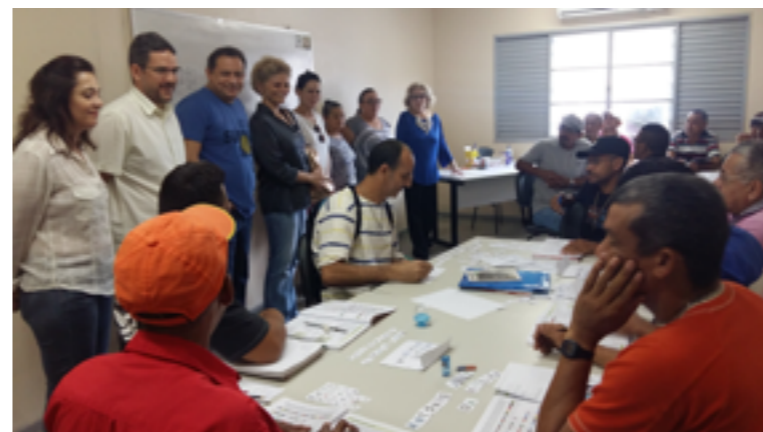
São ofertados cursos de alfabetização, ensino básico e preparatório

O Judiciário do Ceará mantém o projeto “Aprendizes da Liberdade”, que substitui o recolhimento à unidade prisional, nos fins de semana, por estudo formal. Podem participar apenados do regime semiaberto.