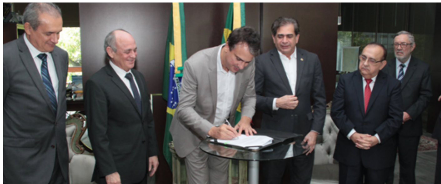
Governador sanciona a lei, no Palácio da Abolição, com a presença do presidente do TJCE e de outros desembargadores

As Varas e os Juizados de todo o Ceará (que formam a 1ª Instância ou o 1º Grau) ganharão reforço de pessoal para aumentar a produtividade, reduzir o tempo de tramitação dos processos e melhorar a qualidade do serviço. Esse avanço ocorrerá, sem aumento de custos, com a lei que transfere recursos utilizados na remuneração do 2º Grau (Tribunal de Justiça) para o 1º Grau.