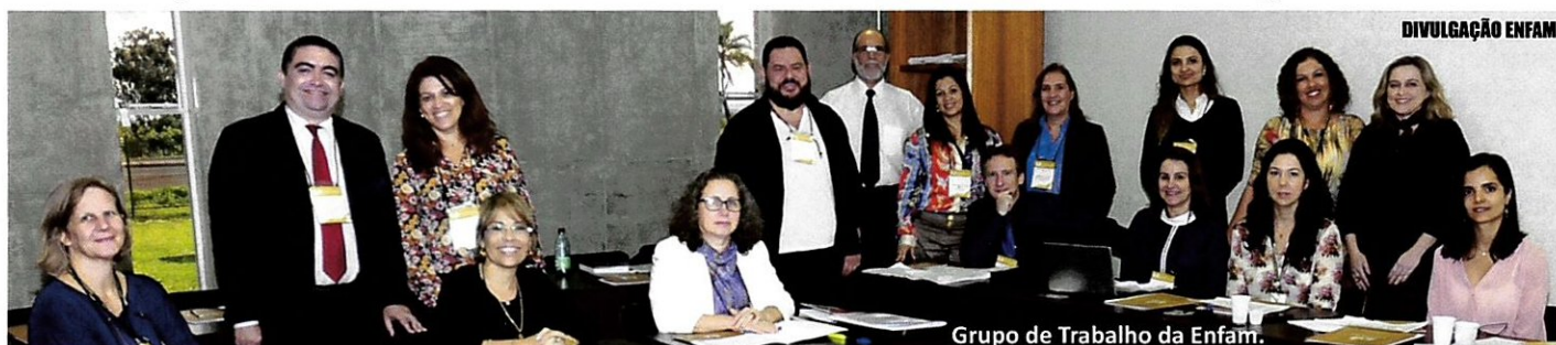
Grupo de Trabalho da Enfam.