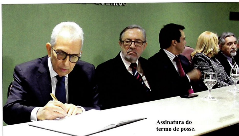
Assinatura do termo de posse.

O Diretor da Esmec citou ainda outras prioridades de sua gestão: sintonia com as metas traçadas pela Enfam e pelo Conselho Nacional de Justiça (CNJ); estudos sobre o novo Código de Processo Civil; ações voltadas para as artes e a responsabilidade social; atualização do Regimento Interno da Esmec; e desenvolvimento de atividades relacionadas aos 30 anos da Escola, que serão comemorados em 2016.