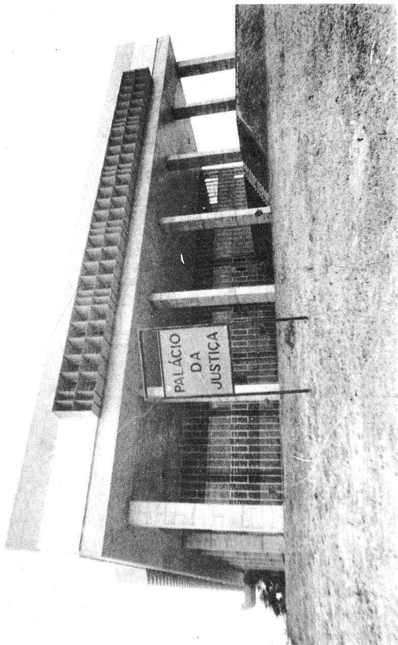
Fachada lateral da sede do Poder Judiciário Cearense, no Centro Administrativo Virgílio Távora (Cambéba), em Fortaleza