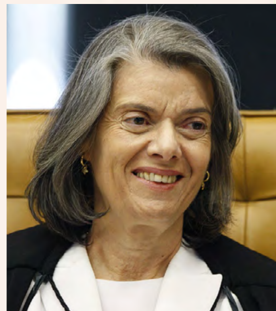
A ministra Cármen Lúcia participará do Encontro